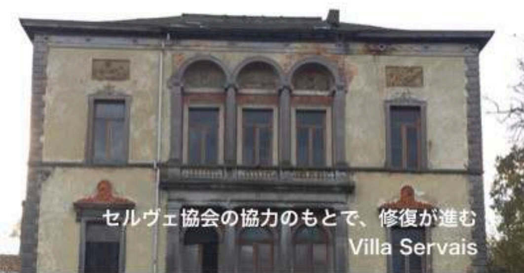
セルヴェ協会の協力のもとで、修復が進む Villa Servais

この町では現在でも、ビールやシャパン、レストランメニューに至るまで、Servaisの名前を冠した物であふれ、没後150年経った今でも市民の尊敬を集めています。