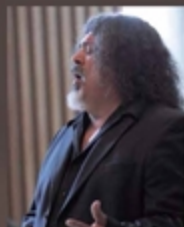
マヌエル・デ・ラ・マレーナ カンテ