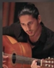
マレーナ・イーホ フラメンコギター